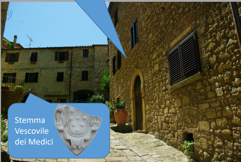
Stemma Vescovile dei Medici

L'antica Pieve di Sant'Ilario si affaccia su questa piazza.